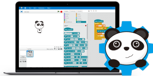
Application mBlock 3.4

On utilise l'application mBlock afin de programmer le microcontrôleur Arduino et ses composants. Le microcontrôleur Arduino est relié en USB à l'ordinateur.