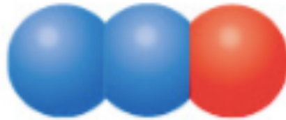
B protoxyde d'azote