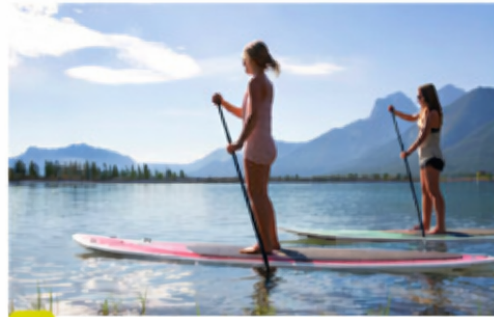
B Un stand-up paddle