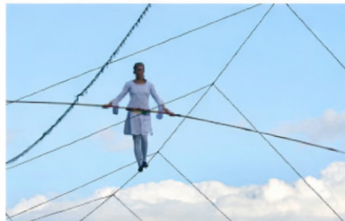
D Un funambule sur un fil