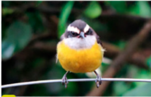
A Un oiseau sur une branche

Pour chacune des situations suivantes, dire si l'objet étudié possède une énergie cinétique et/ou une énergie de position.